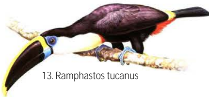
13. Ramphastos tucanus