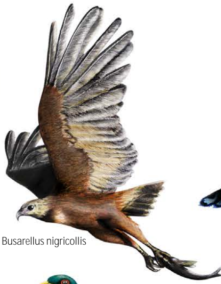
1. Busarellus nigricollis