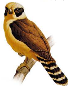
11. Herpetotheres cachinnans