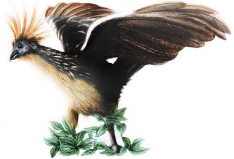
5. Opisthocomus hoazin