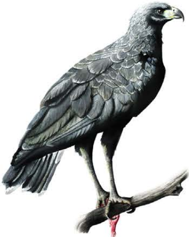
6. Buteogallus urubitinga