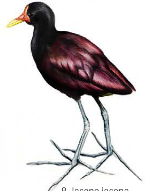
8. Jacana jacana