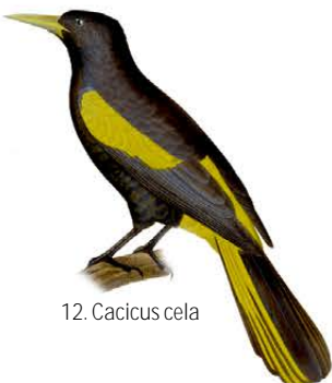
12. Cacicus cela