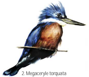
2. Megaceryle torquata