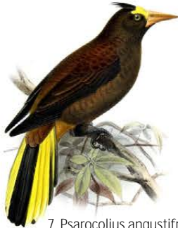
7. Psarocolius angustifrons