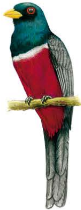
4. Trogon melanurus