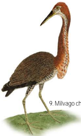
9. Milvago chimachima