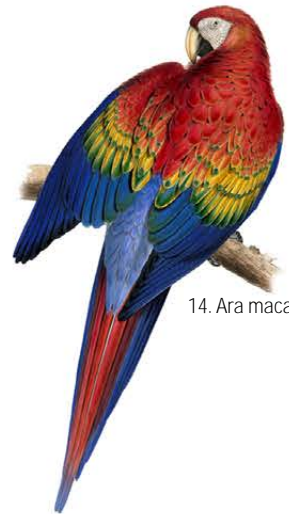
14. Ara macao